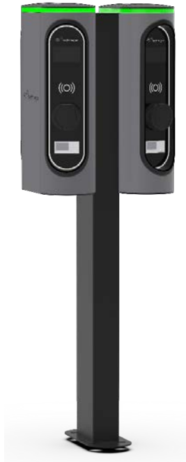
Stele mit zwei montierten W40