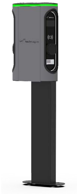
Stele mit einer montierten W40