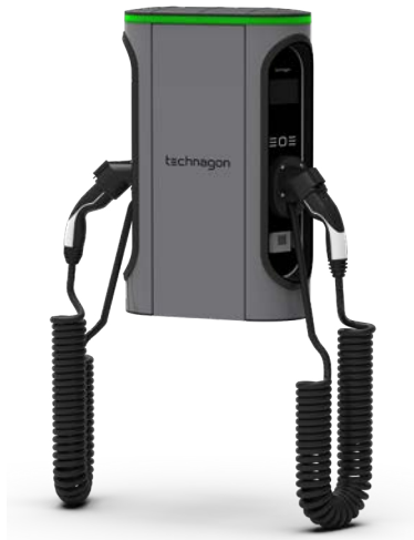
mit AGK (angeschlagenes Kabel) als Option