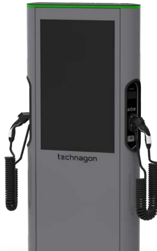
mit AGK (angeschlagenes Kabel) als Option